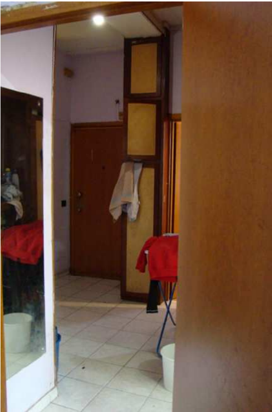
6. Vista dell'ingresso.