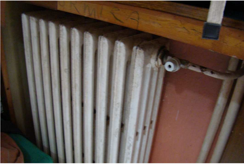
17. Dettaglio degli elementi radianti.