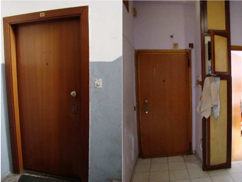
5. Dettaglio della porta di accesso all'alloggio, dal pianerottolo e dall'interno.