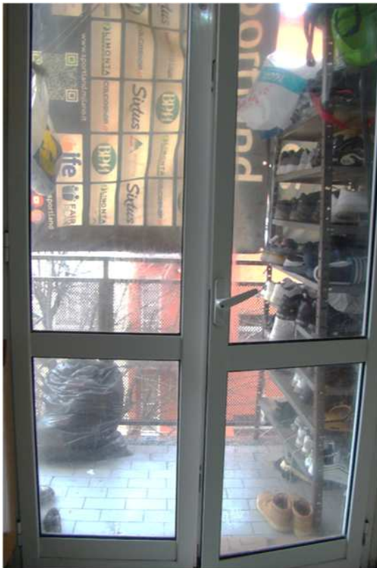
16. Dettaglio del serramento.