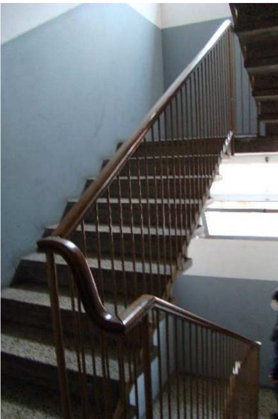
4. Dettaglio della scala condominiale.