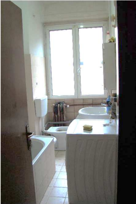
11. Vista del bagno.