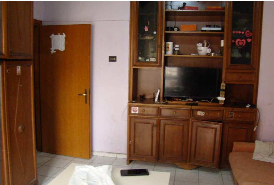
8. Vista del soggiorno.