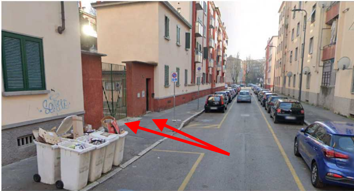
1. Rilievo fotografico del contesto. Vista su via Tracia con indicazione dell'accesso pedonale e carrabile.