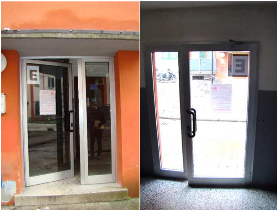
3. Dettaglio del portone di accesso sul cortile interno, dall'esterno e dall'interno.