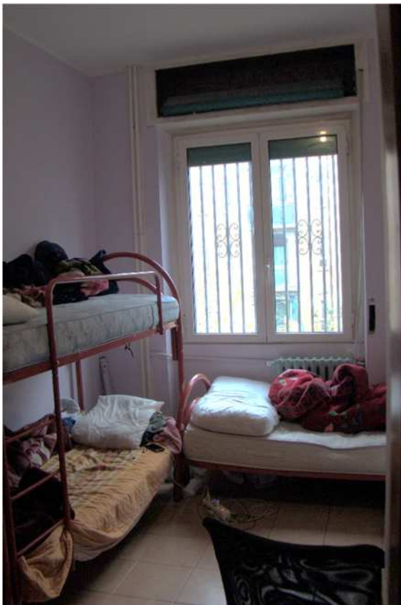
12. Vista della camera.