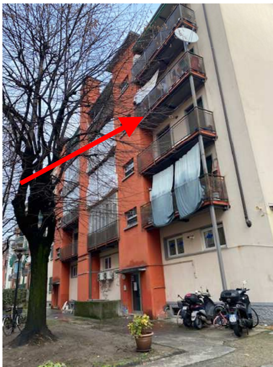
2. Rilievo fotografico del contesto. Vista della facciata del corpo interno con indicazione degli affacci dell'immobile.