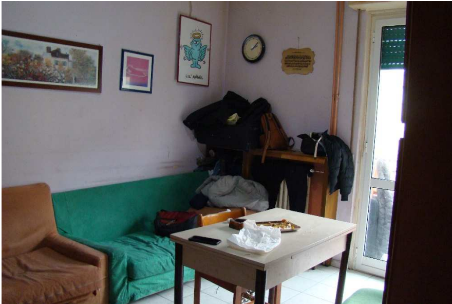
9. Vista del soggiorno.