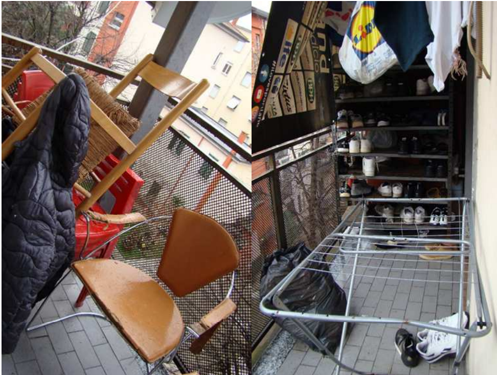
10. Viste del balcone.