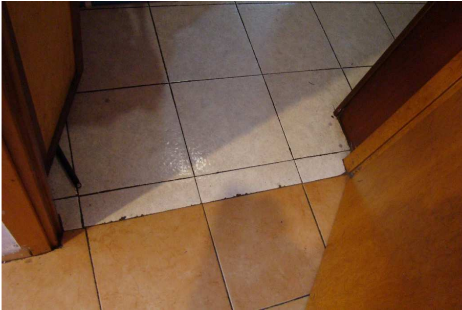
15. Dettaglio del pavimento tra la "cucina" e l'ingresso.