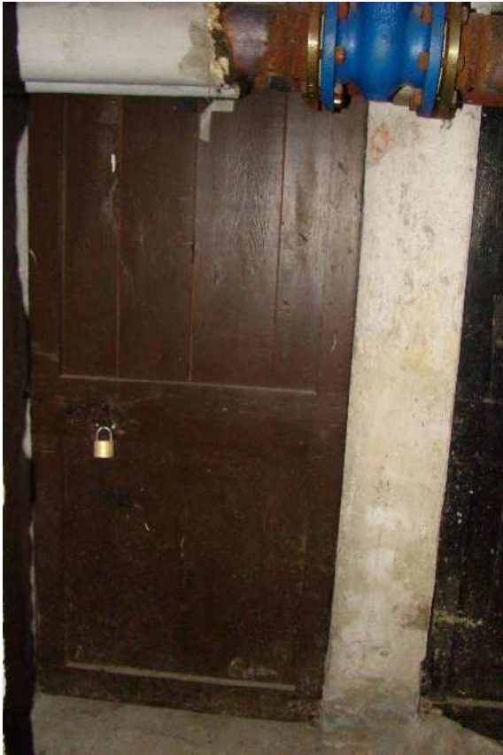
18. Individuazione della cantina di pertinenza.