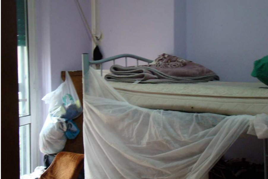
13. Vista della camera.