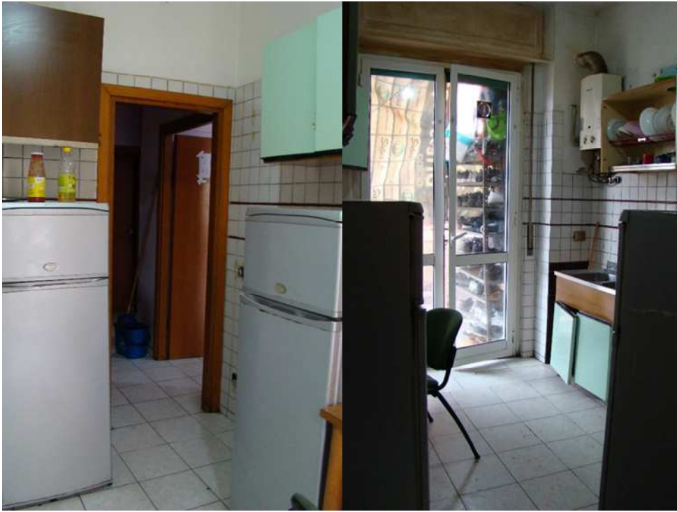
7. Viste della cucina.