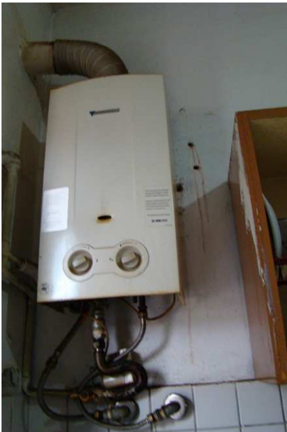
14. Dettaglio della caldaia per la produzione dell'acqua calda.